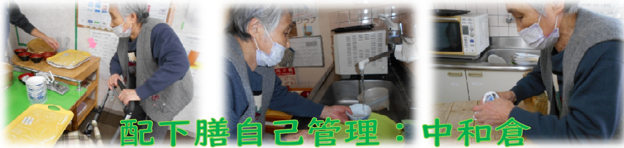
配下膳自己管理：中和倉

株式会社いきいき舎 ホームページアドレス http://www.ikiikisya.com/ 〒270-0034 千葉県松戸市新松戸 2-9 トレノ新松戸 4F TEL047-711-9637/FAX711-9638