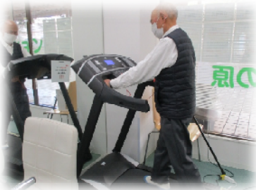
①背筋伸ばして歩行練習