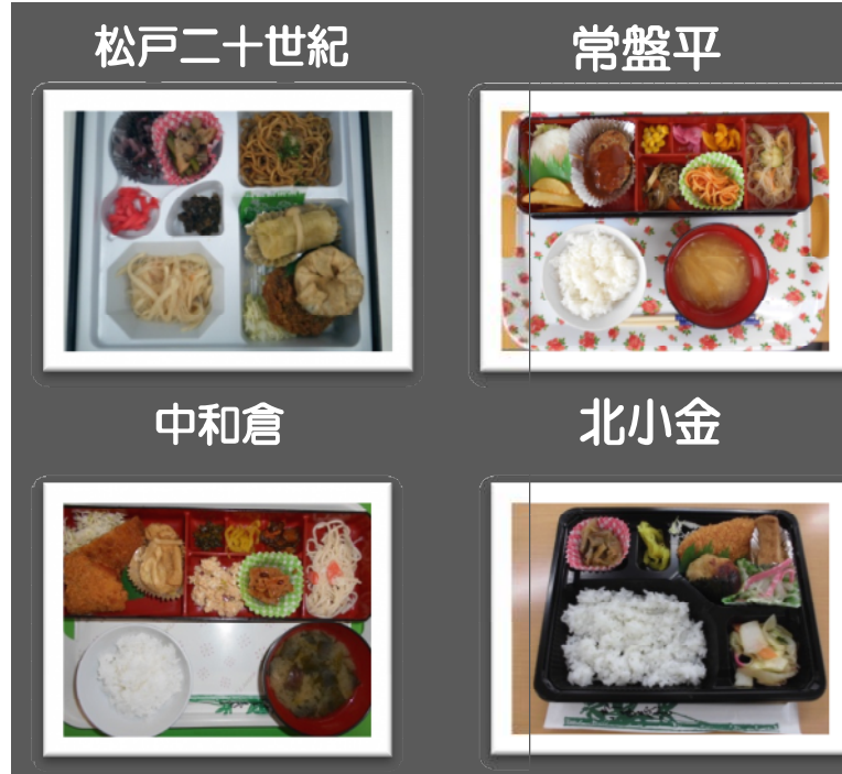
◆昼食（有）・常盤平 ・中和倉 ・北小金 ・松戸二十世紀 ◇昼食（無）・牧の原 ・松戸新田 ・さくら通り ・南流山